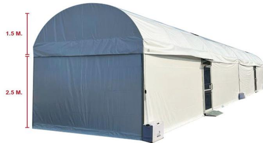
เต็นท์ ขนาด 5x12 เมตร

(2.6) ภายในเต็นท์ขนาด 5x10 เมตร (ติดตั้งปรับอากาศ) ออกแบบและติดตั้งจุดให้บริการสุขภาพ (ขวดแผนไทย) จัดทำพื้นยกระดับภายในโครงสร้างหลัก โดยยกพื้นไม้ หรือไม้อัด ความสูงจากพื้นไม่น้อยกว่า 60 เซนติเมตร โดยพื้นดังกล่าวต้องยึดติดบนโครงอย่างแน่นหนา ด้านบนปูพรมสีเดียวกันครอบคลุมพื้นที่ให้สวยงาม สำหรับปูเบาะรองนอนขนาด 100x200 เซนติเมตร จำนวน 10 เบาะ